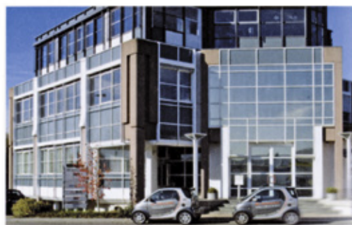
Das moderne Firmengebäude von Abt Print und Medien spiegelt den offenen und fortschrittlichen Geist des Unternehmens wider.

Print: Wie viele Kunden setzen ihr System derzeit ein?